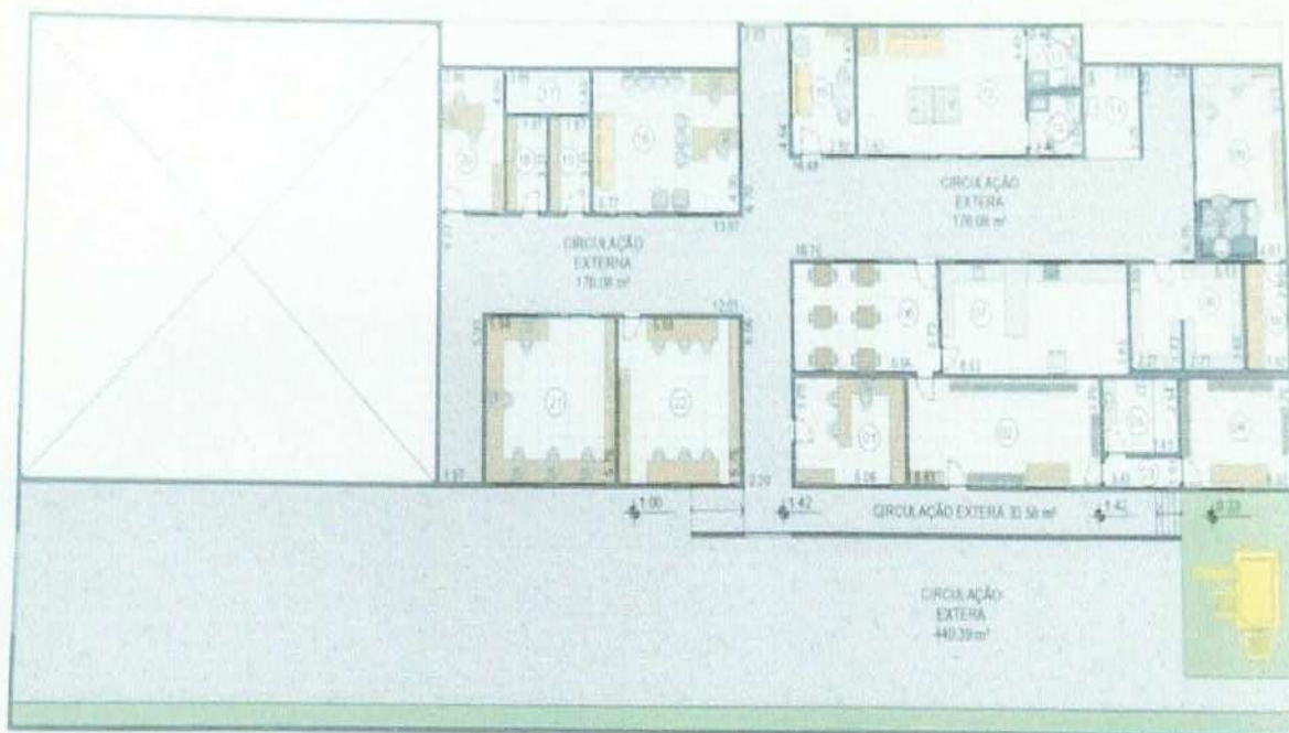
PLANTA DE LAYOUT