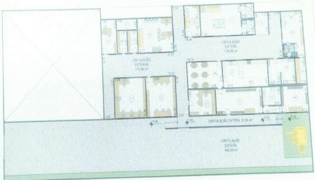
PLANTA DE LAYOUT 1:2M ESCALA